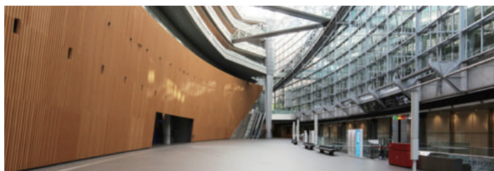
素晴らしい会場 Best Place