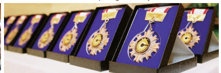
世界で唯一の天才賞 World Only Genius Award