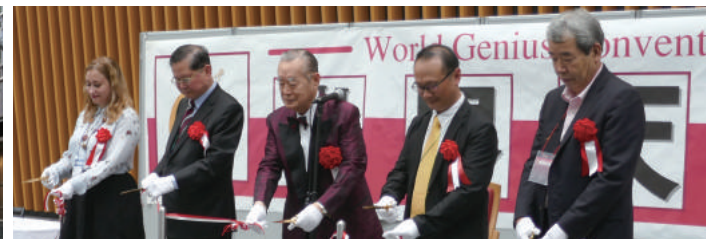
開会式 Opening Ceremony