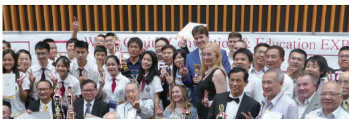
世界各国から天才が集合 Geniuses all over the world