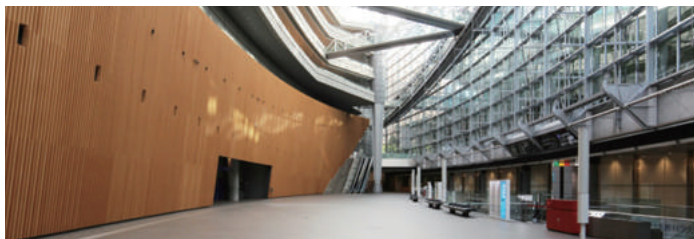
素晴らしい会場 Best Place