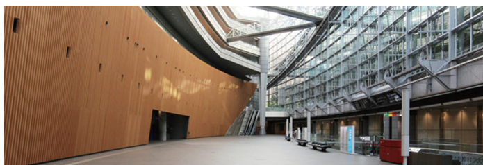
素晴らしい会場 Best Place

The Chairman, World Genius Convention & International Invention & Innovation Institute (IIII) Sir Dr. Yoshiro Nakamatsu