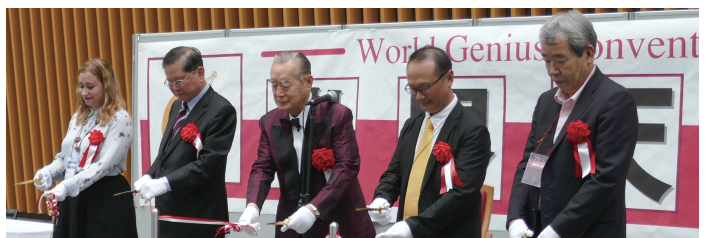
開会式 Opening Ceremony