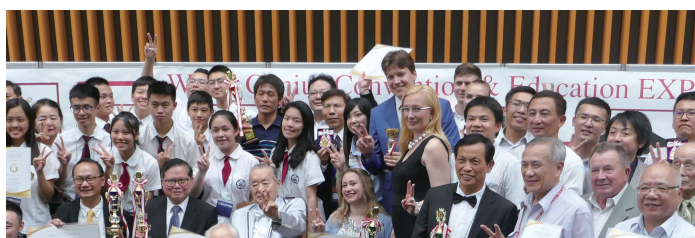
世界各国から天才が集 Geniuses all over the world