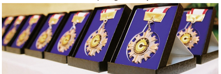
世界で唯一の天才賞 World Only Genius Award